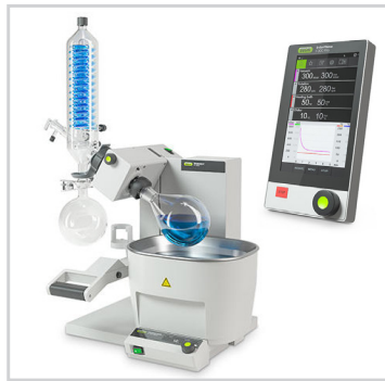
Rotavapor® R-300 mit Kontrolleinheit I-300

BÜCHI stand 2014 vor der Einführung von gleich zwei neuen Produktserien: Rotavapor® R-100 und R-300. Für beide Systeme waren auch neue Bedienungsanleitungen erforderlich. Rund ein Jahr zuvor traf das Unternehmen die Entscheidung, das Redaktionssystem SCHEMA ST4 einzuführen. Um die interne Redaktion zu entlasten, wurde daher ein externer Partner gesucht, der neben seiner Expertise rund um die Dokumentationserstellung auch über die notwendige Systemkompetenz zum Einsatz von SCHEMA ST4 verfügt. Erstmals wurden externe Dokumentationsdienstleister um eine kritische Einschätzung zur aktuellen Redaktionsaufgabe gebeten. Nach der Präsentation und Angebotskalkulation erhielt Dokuwerk den Zuschlag für die anstehenden Dokumentationsaufgaben.