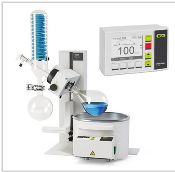
Rotavapor® R-100 mit Kontrolleinheit I-100