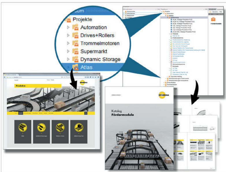
Re-use und Cross Media Nutzung der Inhalte aus Schema ST4 für die Produktseiten im Web und im Printkatalog

Produktdaten, Bilder und Grafiken können in ST4 als einzelne Bausteine abgespeichert werden. So sind Textmodule und Grafikknoten medienneutral einsetzbar und beliebig oft zu verknüpfen. Diese Wiederverwendung vereinfacht den Publikationsprozess wesentlich und erspart Aufwand und Kosten.